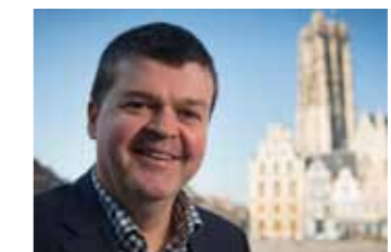
Bart Somers, Burgemeester

Den Botanique Den Botaniek Bruul Mechelen